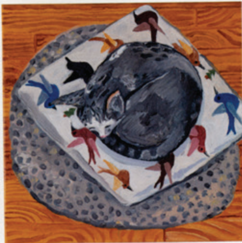
Mitsou Sleeping , 2010 Oil on canvas / Öl auf Leinwand 31 x 30 cm