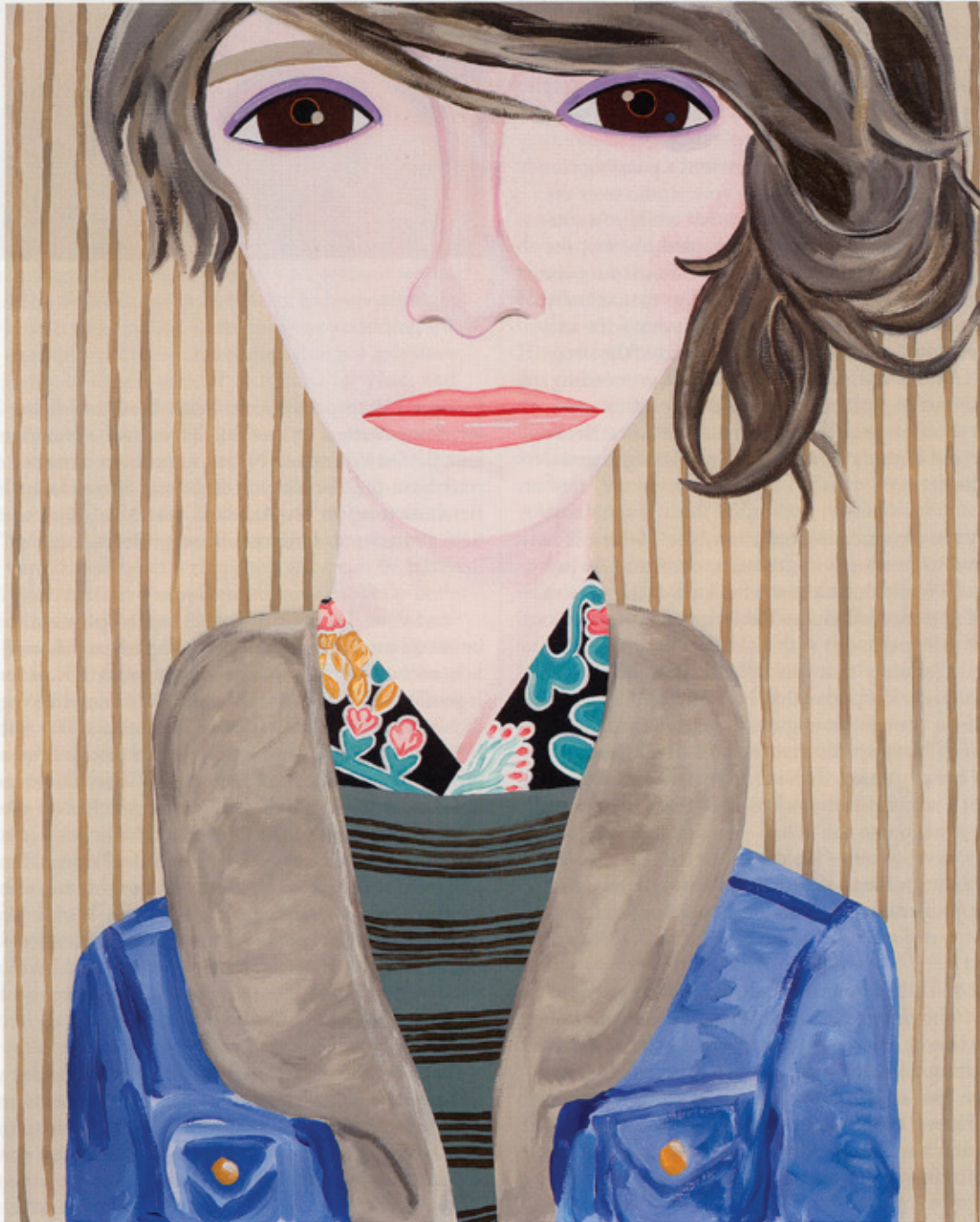
Pinch , 2009 Acrylic on canvas / Acryl auf Leinwand 152 x 122 cm Courtesy Anton Kern Gallery, New York; Corvi-Mora, London © the artist