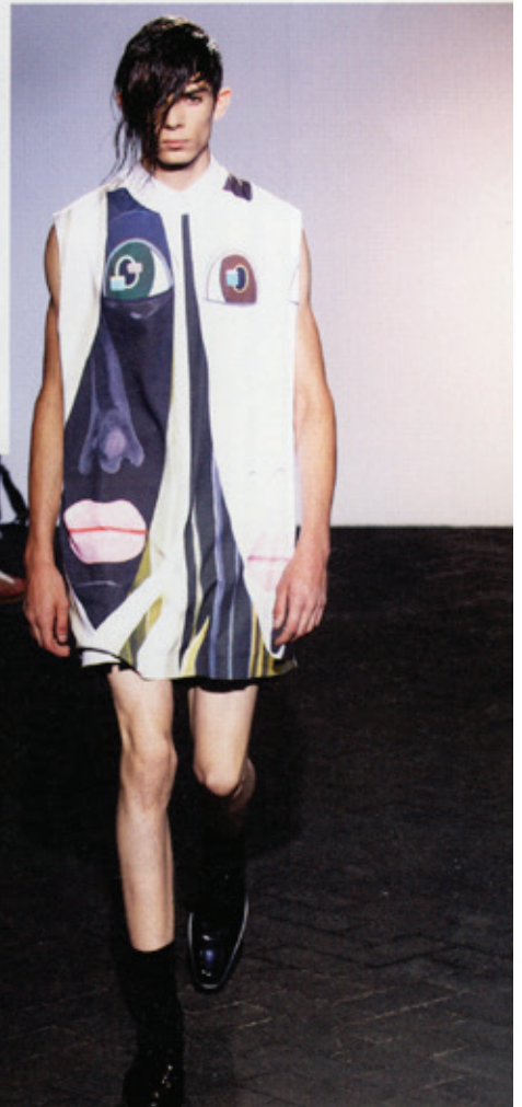
Raf Simons' Spring/Summer 2013 menswear collection / Herrenkollektion Frühjahr/Sommer 2013