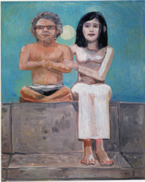
End of Messages , 2012 Oil on canvas / Öl auf Leinwand 102 x 81 cm