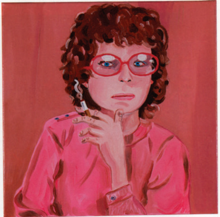
LAX , 2010 Oil on canvas / Öl auf Leinwand 30 x 30 cm Courtesy Corvi-Mora, London