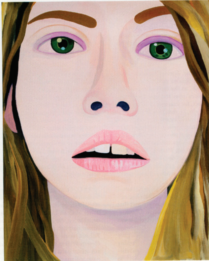
Memory of a Sister (Con) , 2012 Acrylic on canvas / Acryl auf Leinwand 153 x 122 cm

Bruce Hainley spricht mit dem amerikanischen Maler Brian Calvin über Denken durch Malen, produktive Planlosigkeit, seine Zusammenarbeit mit dem Modedesigner Raf Simons und die Simpsons.