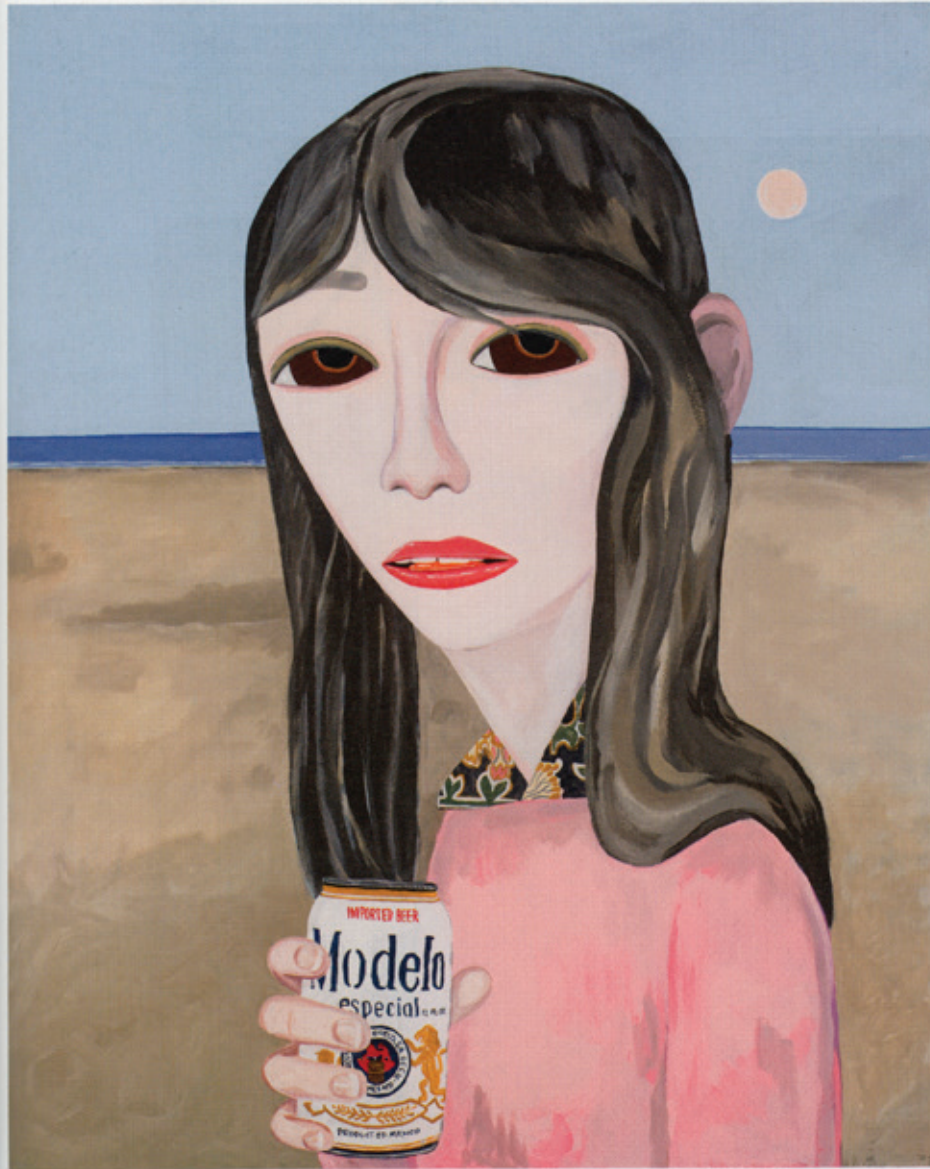
Alta California, 2009 Acrylic on canvas/Acryl auf Leinwand 152 x 122 cm